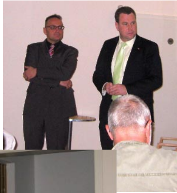
Zahlreiche Bürgerinnen und Bürger kamen zur Veranstaltung nach Priors.