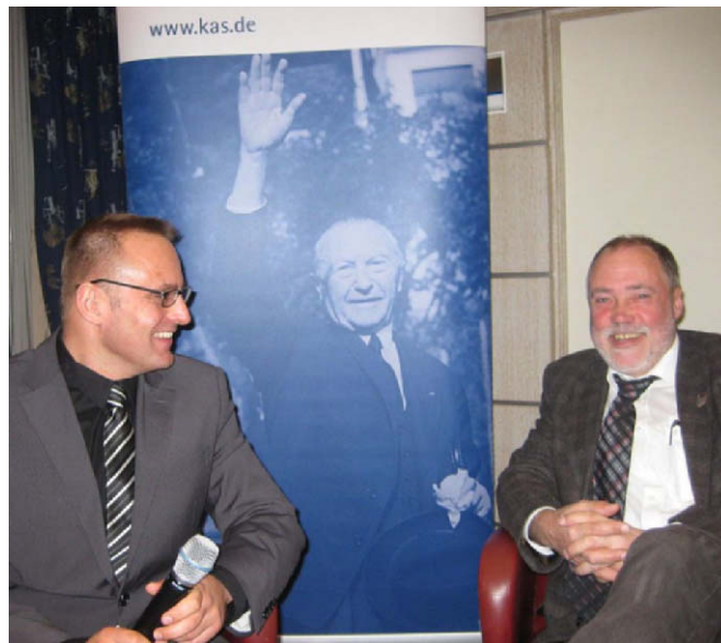
06.12.2010 Vorweihnachtlicher Politalk der FU-LDS im Bürgerbüro Wildau