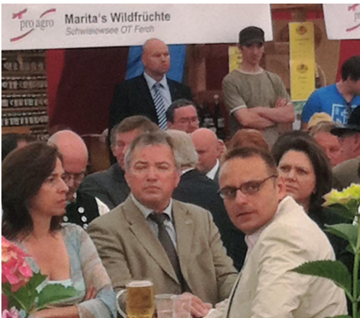
03.06.2011 BraLa mit Bundesministerin Ilse Aigner, MdB