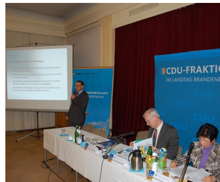
14.03.2011 Vorstellung des Positionspapiers im KV Märkisch Oderland.