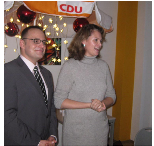
Die Landesvorsitzende Saskia Ludwig (MdL) in vorweihnachtlicher Freudenstimmung.