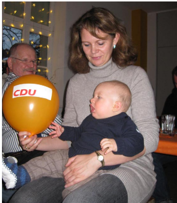
Der Nachwuchs übt für den Weihnachtsmann