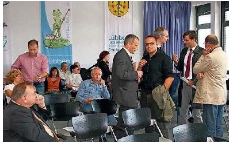
07.09.2010 Fachgespräch Polizeireform in Lübben