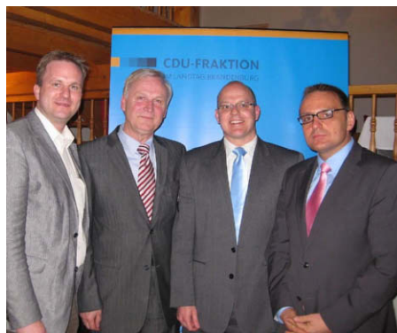
29.03.2011 Vorstellung im KV Teltow Fläming.