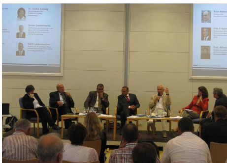
06.06.2011 Abschlusskongress zur Landwirtschaftstour am Seddiner See