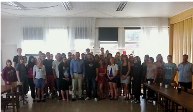
15.06.2011 Besuch Europahaus Kolberg/Heidesee