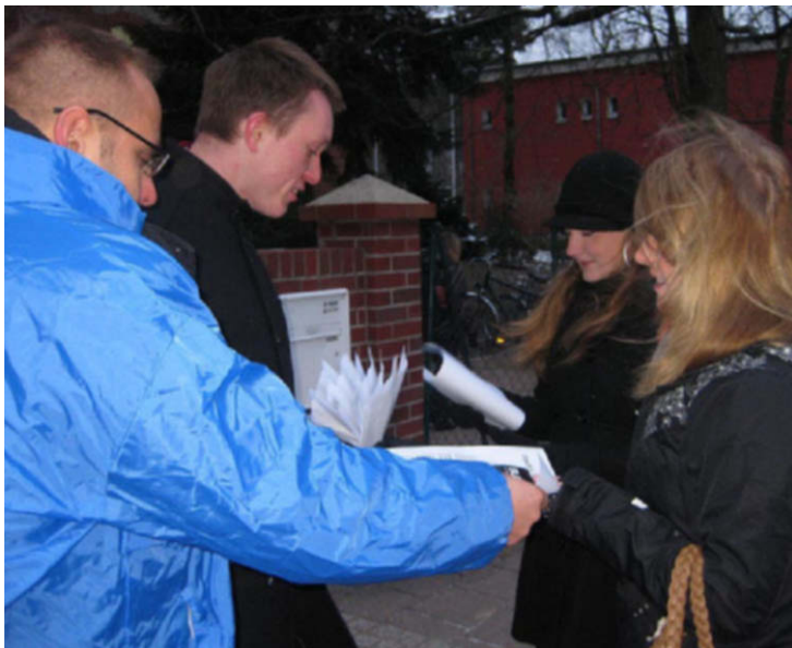
01.12.2010 Aktion der JU zum Weltaidstag