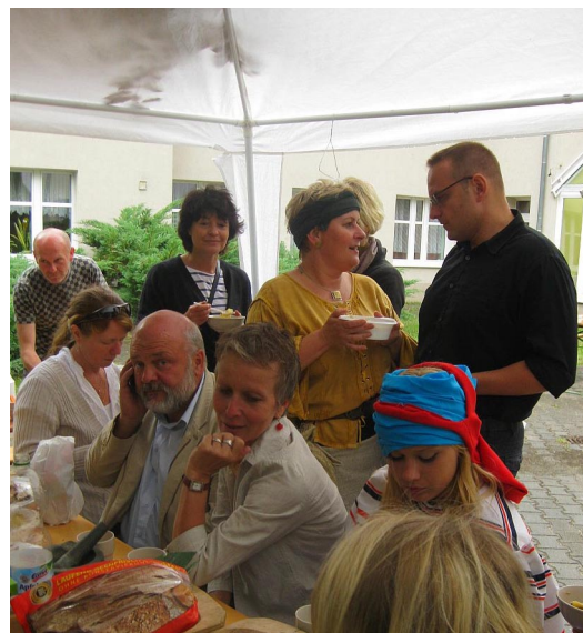
24.06.2011 Sommerfest im Kinder- und Jugenddorf Rankenheim