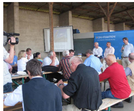
20.05.2011 Vorstellung im KV Dahme-Spreewald.