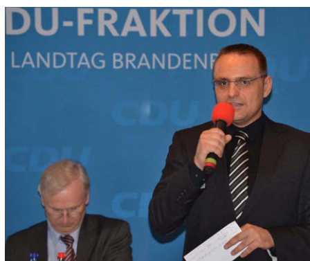
17.03.2011 Vorstellung im KV Potsdam-Mittelmark.