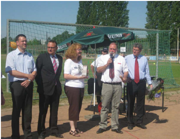
31.05.2011 Integrationstag in Schönefeld