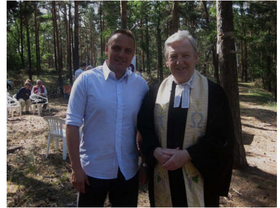
02.06.2011 Himmelfahrtsgottesdienst auf dem Kahlberg