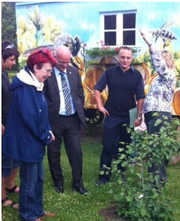
20.06.2011 Eröffnung der Waldjugendspiele an der Europaschule Johann-Gottfried-Herder in Königs Wusterhausen