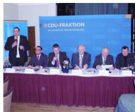
25.03.2011 Vorstellung im KV Prignitz.